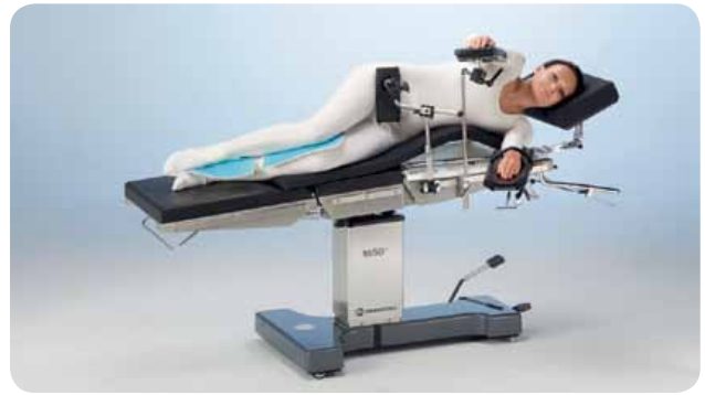
Общая хирургия в латеральном положении, операция на почках на позиции Flex или с помощью отдельной опорой для операции на почках