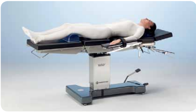
Общая хирургия, ЛОР-хирургия, операция на щитовидной железе