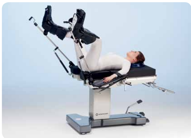
Позиция литотомии с опорами для ног, например, для гинекологии/урологии