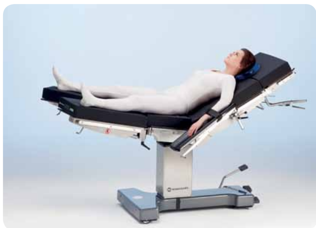
Позиция литотомии с разделенной ножной секцией, например, для лапароскопии и бариатрической хирургии