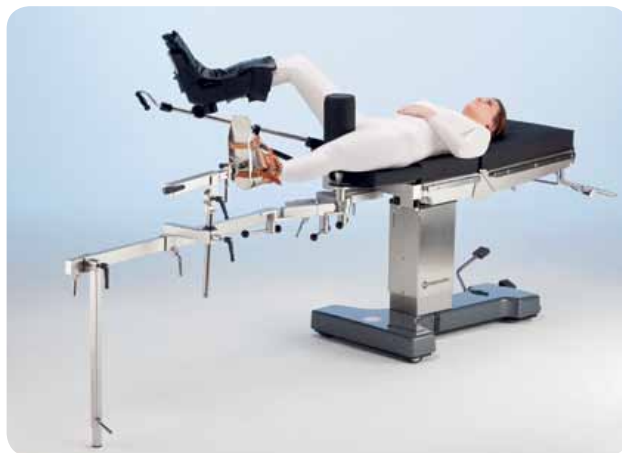
Ортопедическое приспособление 19300 для травматологии

За дополнительной информацией обращайтесь, пожалуйста, к нашему каталогу или сайту: www.merivaara.ru .