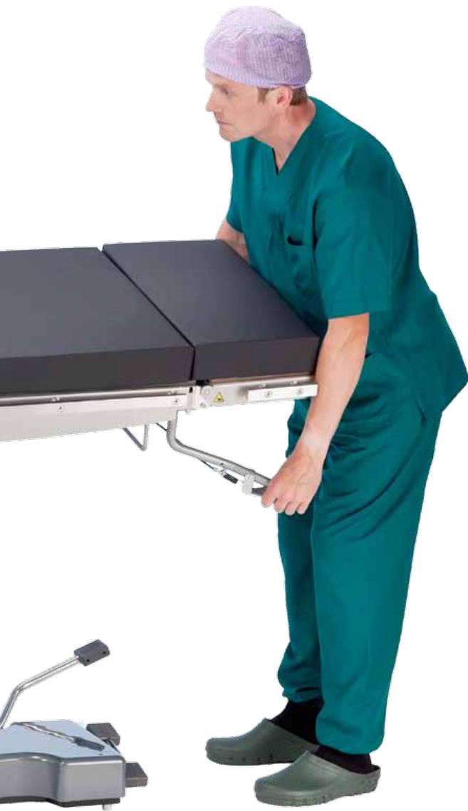
Боковой наклон с помощью газовой пружины